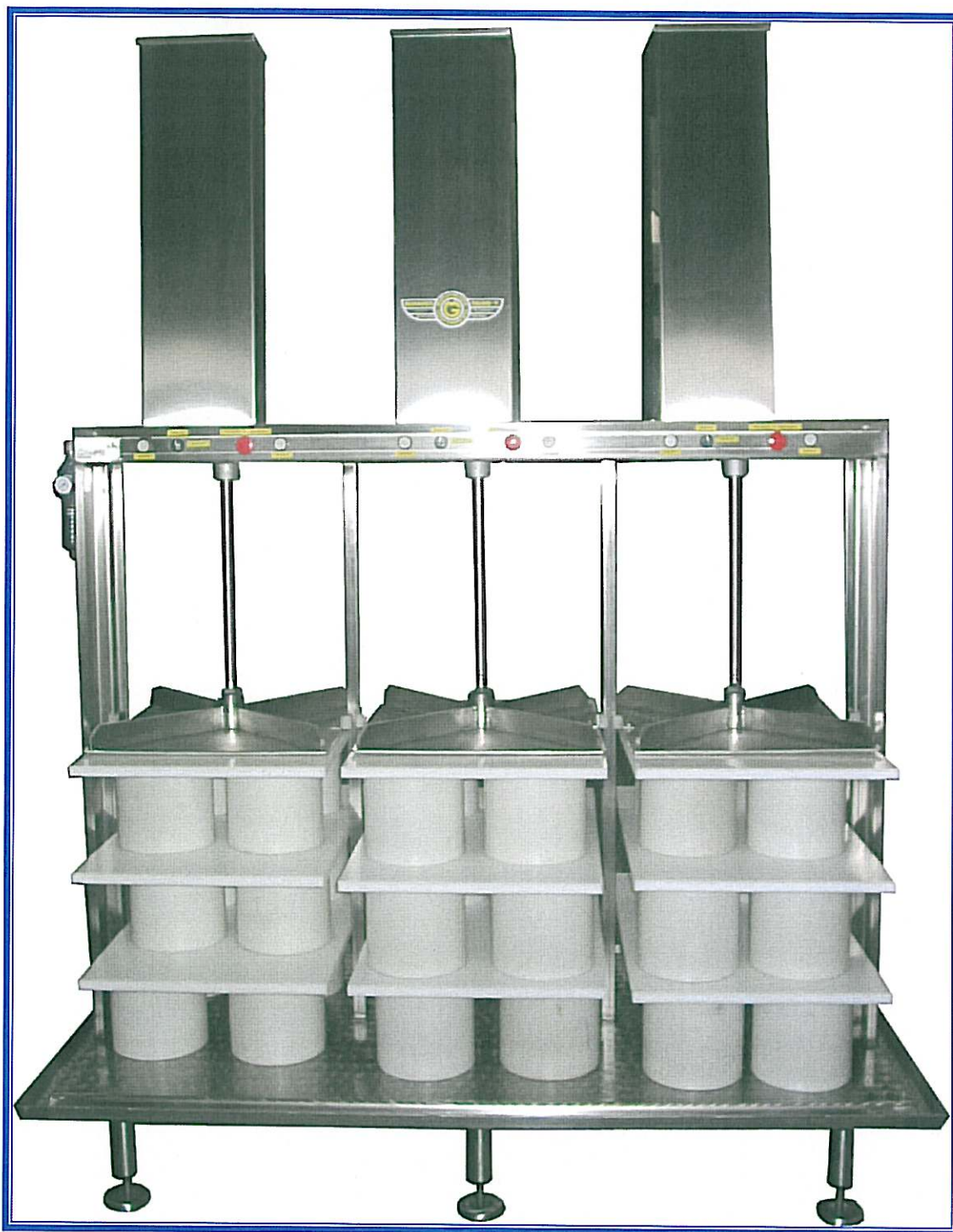
PRESSA PNEUMATICA ORIGINALE "MAGNABOSCO" Modello a tre colonne

Magnabosco S.r.l. – Via Roma, 19 – 36030 Zugliano (VI) – Tel. 0445/330111 – Fax 0445/330110-222 e-mail: magnabosco@magnabosco.com