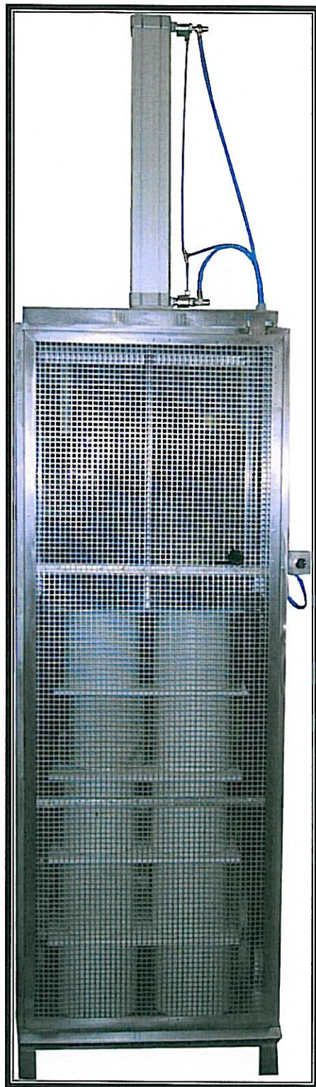
PRESSA PNEUMATICA ORIGINALE "MAGNABOSCO" Modello ad una colonna

Magnabosco S.r.l. – Via Roma, 19 – 36030 Zugliano (VI) – Tel. 0445/330111 – Fax 0445/330110-222 e-mail: magnabosco@magnabosco.com