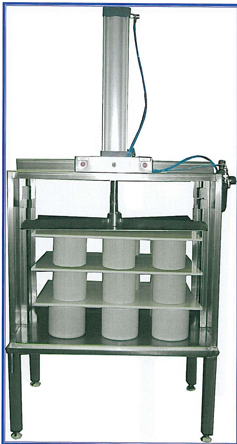
PRESSA PNEUMATICA PER FORMAGGI. Modello a 1 colonna 3 ripiani.

Magnabosco S.r.l. – Via Roma, 19 – 36030 Zugliano (VI) – Tel. 0445/330111 – Fax 0445/330110-222 e-mail: magnabosco@magnabosco.com