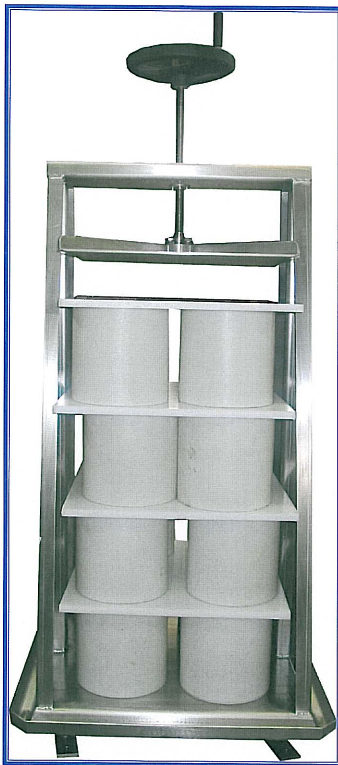
PRESSA MANUALE ORIGINALE "MAGNABOSCO" Modello ad una colonna

Magnabosco S.r.l. – Via Roma, 19 – 36030 Zugliano (VI) – Tel. 0445/330111 – Fax 0445/330110-222 e-mail: magnabosco@magnabosco.com